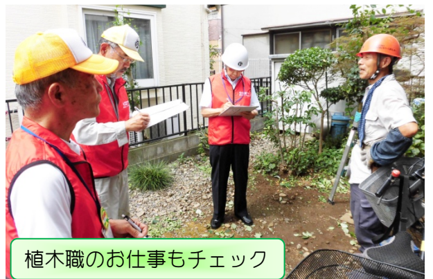
植木職のお仕事もチェック