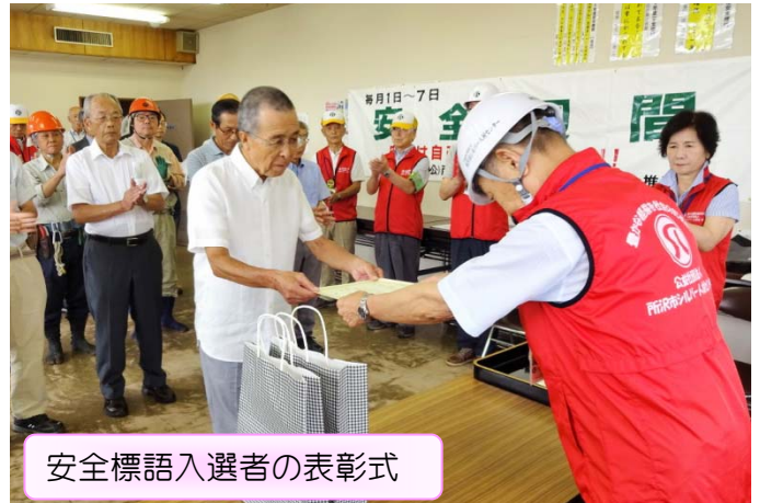
安全標語入選者の表彰式