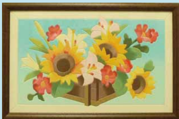
サマーアレンジ 和紙絵 大野ゆり子