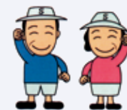
埼玉県シルバー人材センター連合マスコット

「健康のため、生きがいのため、仕事をしたい、地域社会の発展のために貢献したい」とお考えの60歳以上のお元気な皆様、お待ちしております。