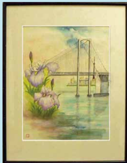
レインボーブリッジ 絵画 青柳金造