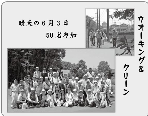
晴天の6月3日 50名参加