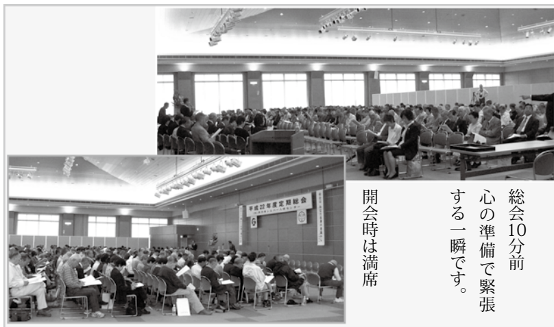
総会10分前 心の準備で緊張する一瞬です。

に上限はあるのか？」という質問があり、就業する際の年齢制限にも関係する問題提起でしたが、検討課題として今後討議されることになる。事務局の回答がありました。総会は無事終了しました。(阪口)