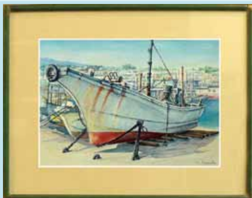
浜におかれた漁船 絵画 藤本芳弘