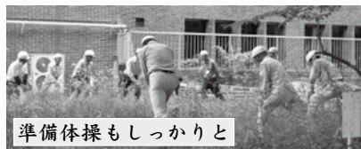
準備体操もしっかりと