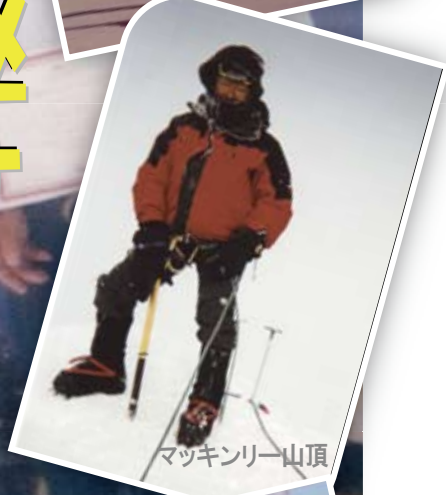
マツキンリー山頂