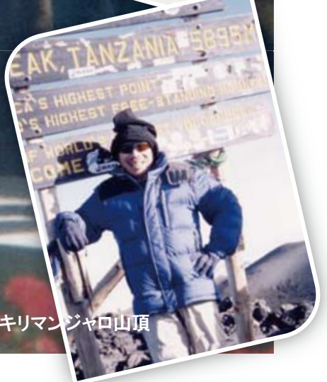
キリマンジャロ山頂