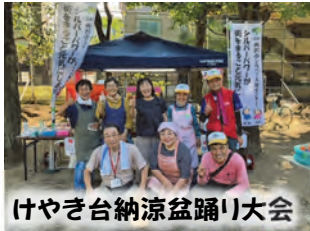
げやき台納涼盆踊り大会